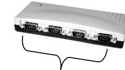
S1 to S4 4 x 9 Pin Serial connector RS232