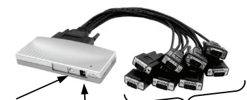
USB B Anschluss