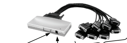
S1 to S8 8 x 9 Pin Serial connector RS232 5V Connector USB B Connector