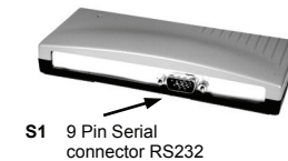
S1 9 Pin Serial connector RS232